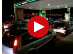
Stori leidt to...