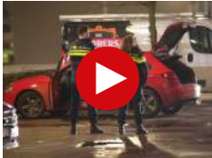
Polit Arnh los...