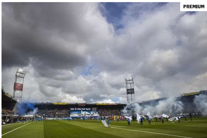
▲ Opkomst van spelers bij de IJsselderby tussen PEC Zwolle en Go Ahead Eagles op 3 april vorig jaar. Er werd vuurwerk gegooid vanaf de noordtribune bij een tunnel onder de tribune (links).