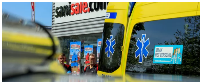
▲ Hulpverleners na het steekincident bij de Sanisale in Amersfoort.