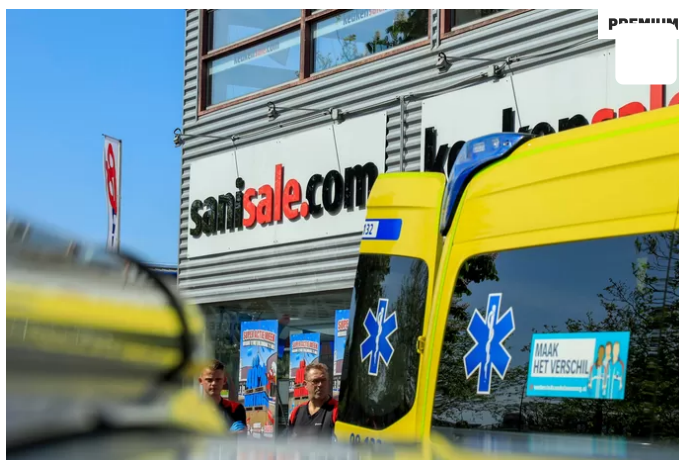
▲ De 60-jarige klant werd met een ambulance afgevoerd.