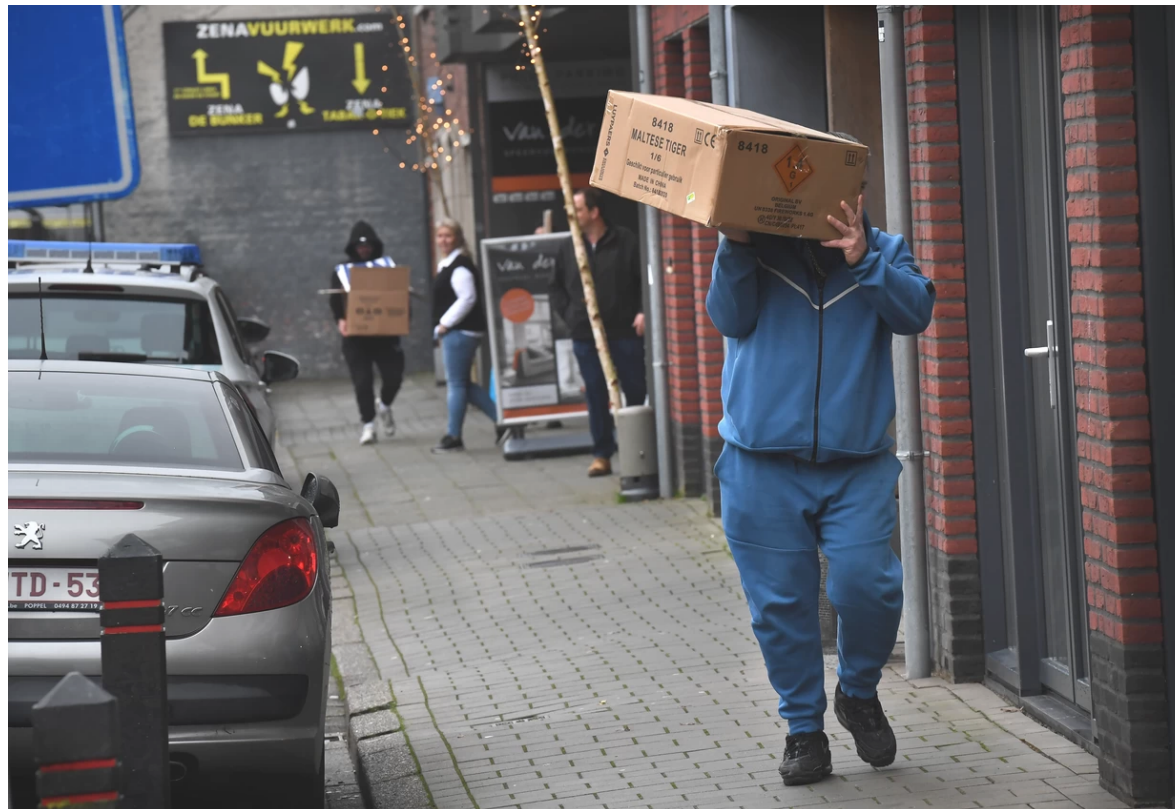
Veel Nederlanders kopen zwaar vuurwerk over de grens met België.